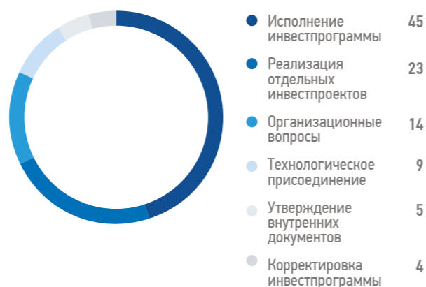
Категории вопросов, рассмотренных Комитетом по инвестициям, %